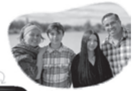
Buli & Aster

Am Samstagabend gibt es belegte Brötchen und Getränke.